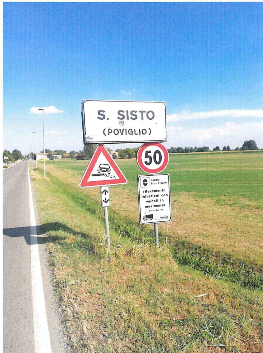
3. VIA PARMA (SP20) KM 2+800 DIR. POVIGLIO