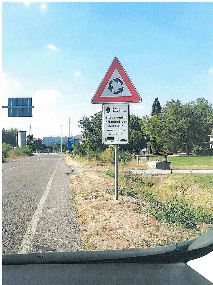
1. VIA PARMA (SP20) KM 0+100 DIR. SORBOLO